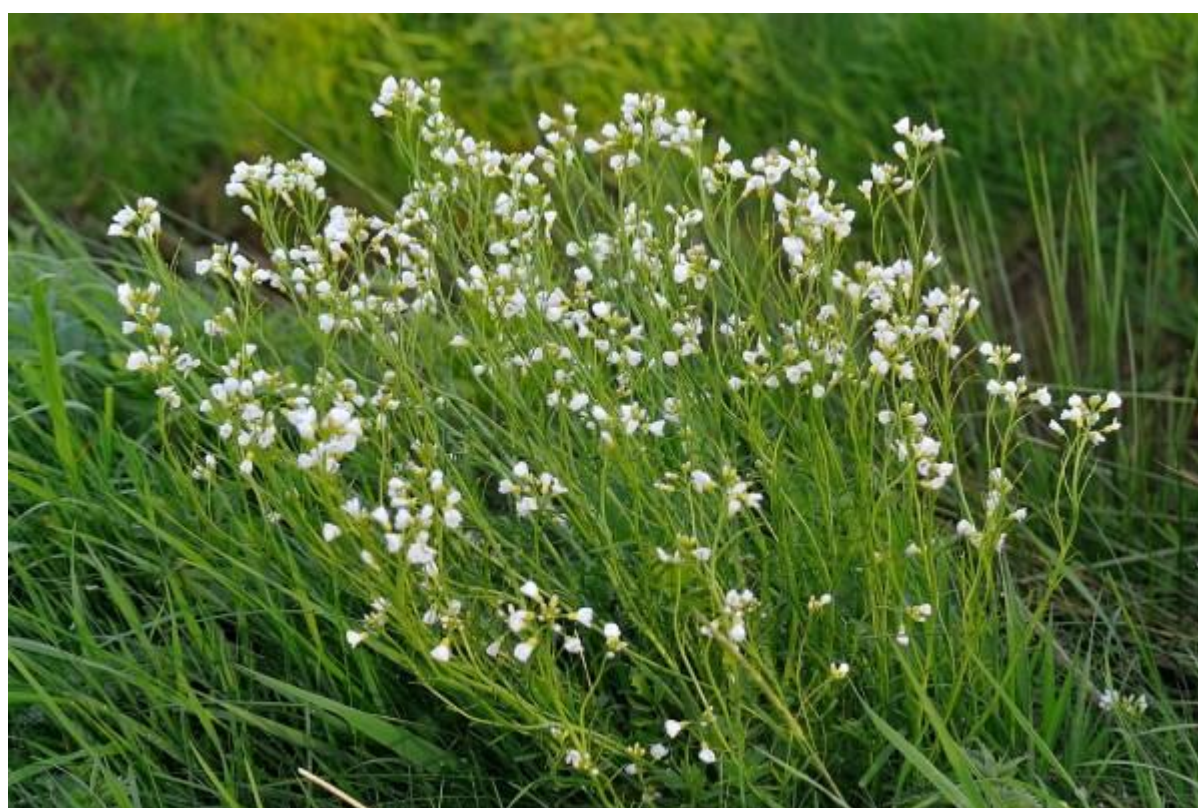
maar dat deert de pinksterbloemen niet