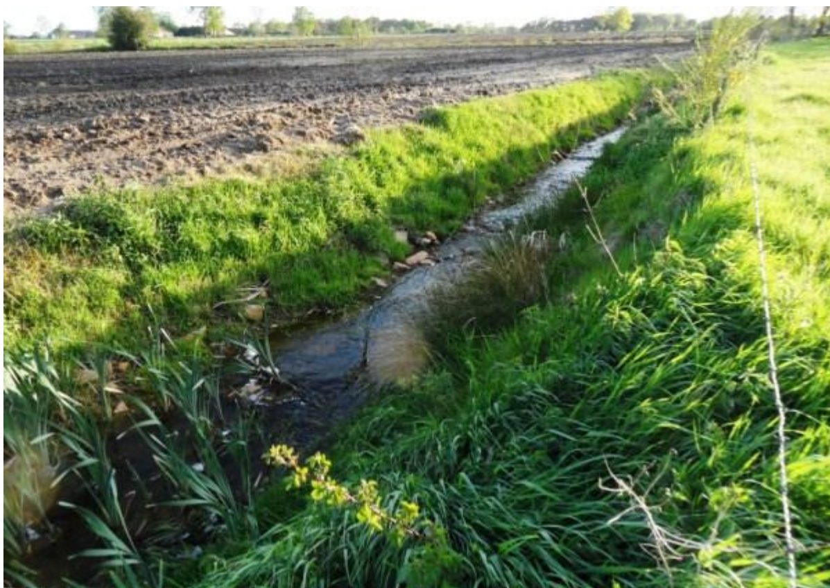
de dommel gaat hier vooral door landbouwgebied